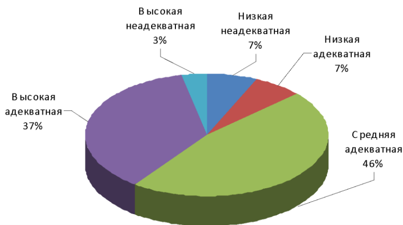
Рис. 2. Распределение уровней самооценки у респондентов по всей выборке